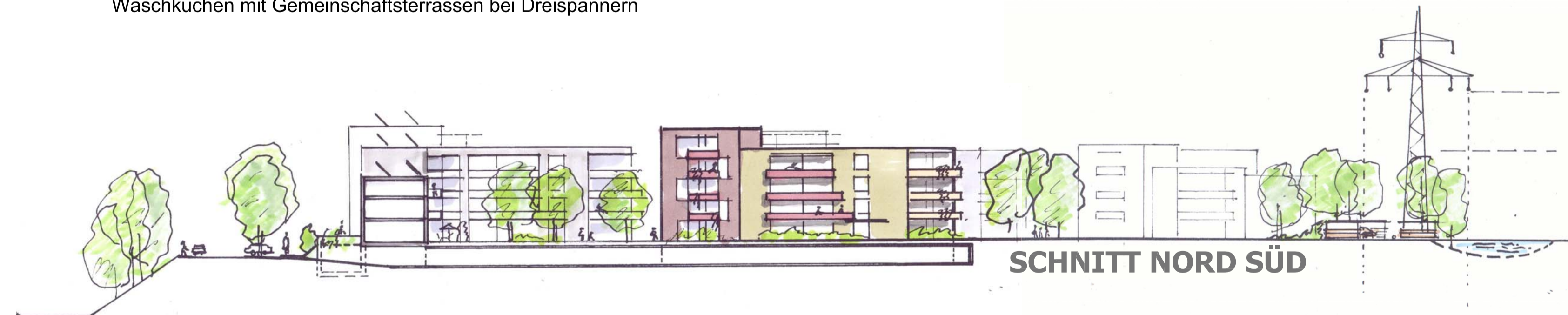
SCHNITT NORD SÜD

Angebot an vielfältigen siedlungsöffentlichen Räumen und privaten Höfen mit Kleinkinderspielbereichen. Großer Siedlungsplatz mit Gemeinschaftsraum / Schlechtwetterspielraum. Zonierung: privat zu privat, öffentlich zu öffentlich. Die Spielhöfe sind von Küchen bzw. Wohnräumen überschaubar. Waschküchen mit Gemeinschaftsterrassen bei Dreispännern